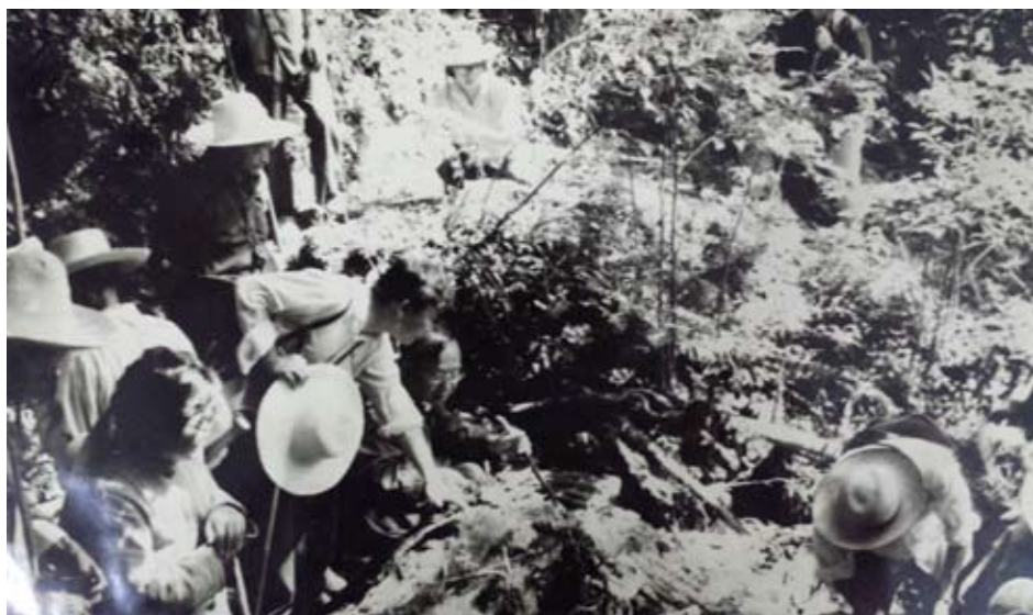
吴征镒教授带领考察队 与地方科技人员在林中 考察